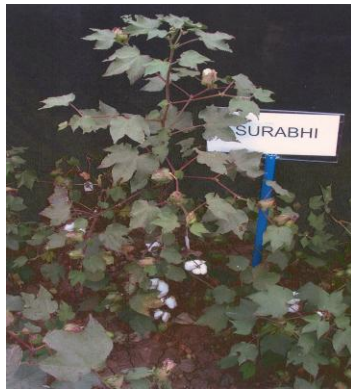
चित्र 13: फसल का सामान्य दृश्य Figure 13: General view of the crop