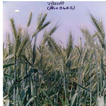
चित्र 02: फसल का सामान्य दृश्य Figure 02: General view of the crop