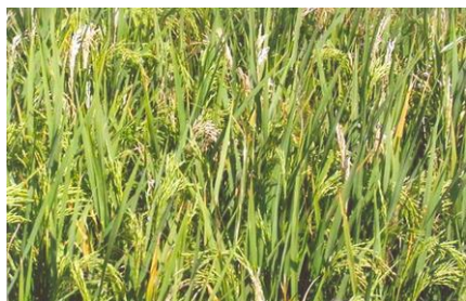
चित्र 02 (क) : फसल का सामान्य दृश्य Figure 02(a): General view of the crop