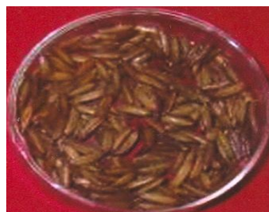
चित्र 03 (घ) : दाना : प्रमेयिका की फिनॉल क्रिया : उपस्थित Figure 03(d): Grain: Phenol reaction of lemma: Present