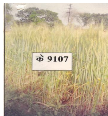
चित्र 04: फसल का सामान्य दृश्य Figure 04: General view of the crop