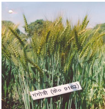
चित्र 07: फसल का सामान्य दृश्य Figure 07: General view of the crop