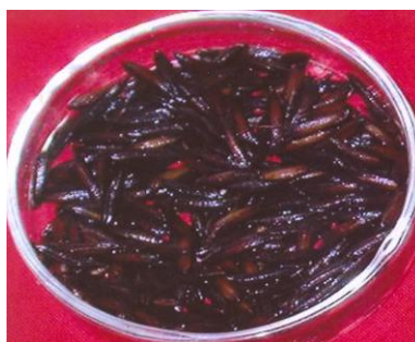
चित्र 02 (ग): दाने : प्रमेयिका की फिनॉल क्रिया : उपस्थित Figure 02(c): Grain: Phenol reaction of lemma: Present