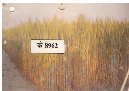
चित्र 09: फसल का सामान्य दृश्य Figure 09: General view of the crop