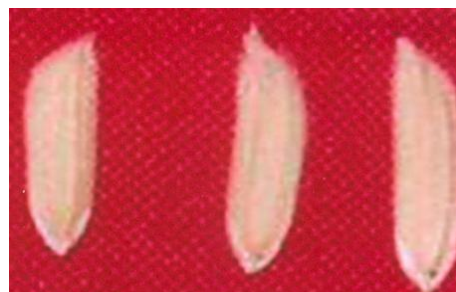
चित्र 03 (ख): पुष्पगुच्छ : शूक : अनुपस्थित Figure 03(b): Panicle: Awns: Absent