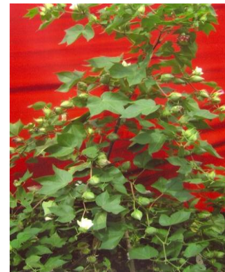
Figure10: Cotton: JC-761