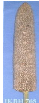
चित्र 06: Figure 06(b): View of the panicle