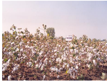
चित्र 14: फसल का सामान्य दृश्य Figure 14: General view of the crop