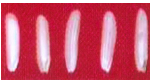
चित्र 03 (ग): दाना : लंबाई : मध्यम लंबा Figure 03(c): Grain: length: Medium Slender