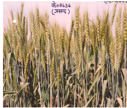
चित्र 06: फसल का सामान्य दृश्य Figure 06: General view of the crop