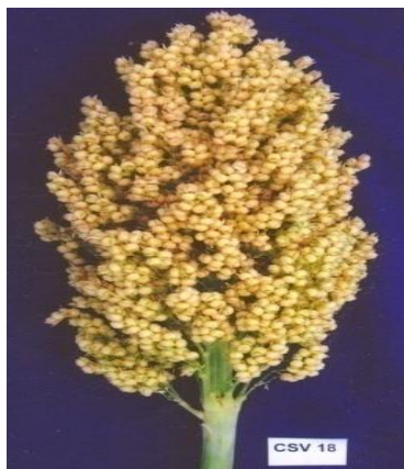
Figure 01: Sorghum : CSV 18