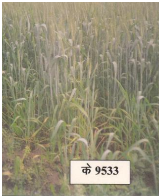
चित्र 05: फसल का सामान्य दृश्य Figure 05: General view of the crop