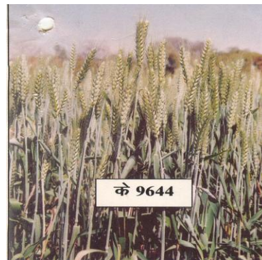
चित्र 08: फसल का सामान्य दृश्य Figure 08: General view of the crop