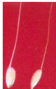
चित्र 01(ख) : पुष्पगुच्छ: शूक : उपस्थित Figure 01(b): Panicle: Awns: Present