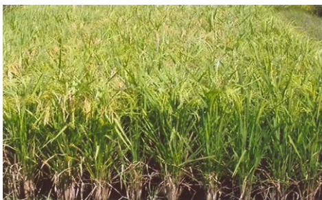
चित्र 03: फसल का सामान्य दृश्य Figure 03(a): General view of the crop