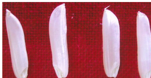
चित्र 02 (ख): छिले हुए दानों का आकार : मध्यम लंबे Figure 02(b): Decorticated grain shape: Medium slender