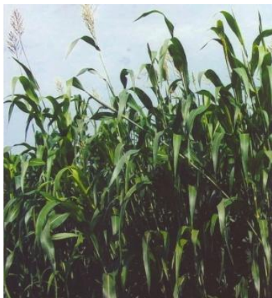
Figure 02: Sorghum: CSV 21 F