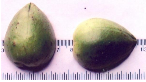
चित्र 03: Figure 03(b): General view of the boll