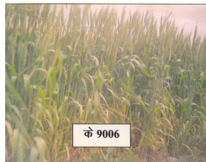
चित्र 10: फसल का सामान्य दृश्य Figure 10: General view of the crop