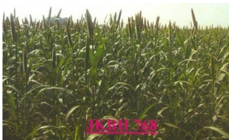
चित्र 06: Figure 06(a): General view of the crop