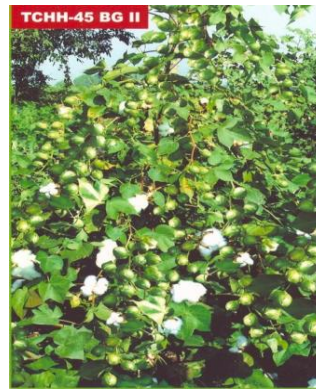
Figure08: Cotton: Tulasi-45 BGII