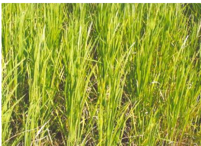
चित्र 01 (क): फसल का सामान्य दृश्य Figure 01(a): General view of the crop