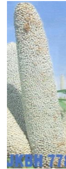
चित्र 05: Figure 05(b): View