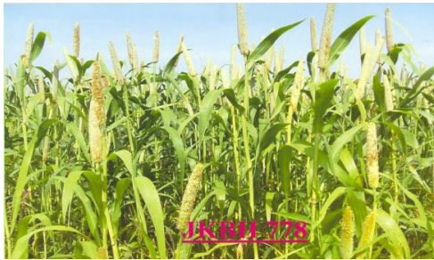
चित्र 05: Figure 05(a): General view of the crop