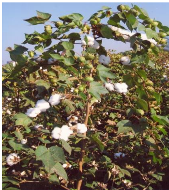
Figure 09: Cotton: KCH-14 K 59 BG II