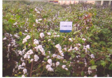
चित्र 12: फसल का सामान्य दृश्य Figure 12: General view of the crop