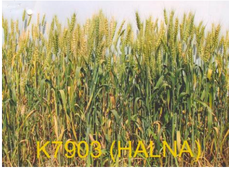
चित्र 11: फसल का सामान्य दृश्य Figure 11: General view of the crop