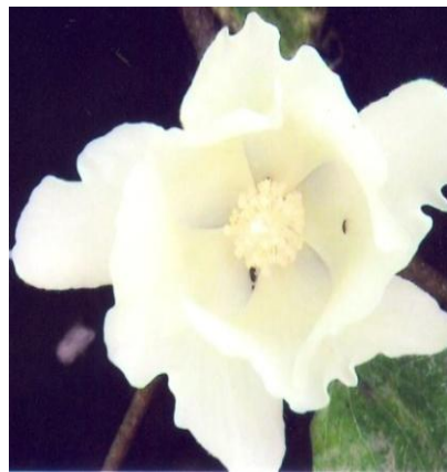
Figure 03: Cotton: MRC 7041