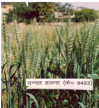
चित्र 03: फसल का सामान्य दृश्य Figure 03: General view of the crop