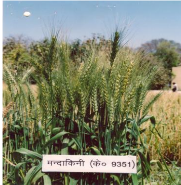
चित्र 01: फसल का सामान्य दृश्य Figure 01: General view of the crop