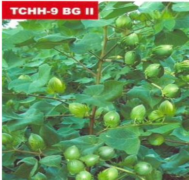
Figure07: Cotton: Tulasi-9 BGII