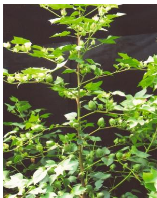
Figure 11: Cotton: JC-348