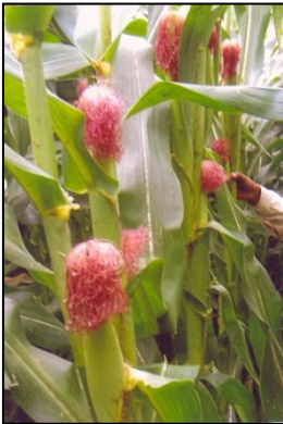
चित्र 02क: फसल का सामान्य दृश्य Figure 02a: General view of the crop