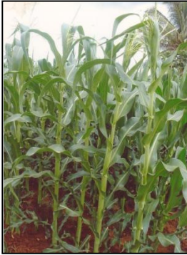
चित्र 04क: फसल का सामान्य दृश्य Figure 04a: General view of the crop