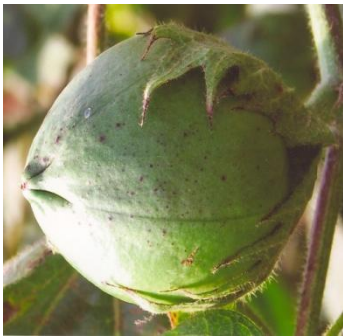
चित्र 05क: गुले का सामान्य दृश्य Figure 05a: General view of the boll