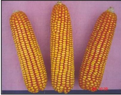
चित्र 03: मक्का : पीएयू 352 (जेएच 3982) Figure 03: Maize: PAU 352 (JH 3982)