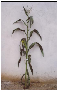
चित्र 06क: पौधे का सामान्य दृश्य Figure 06a: General view of the plant