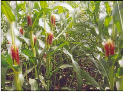
चित्र 01क: फसल का सामान्य दृश्य Figure 01a: General view of the crop