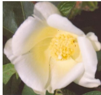
चित्र 05ख: पुष्प का सामान्य दृश्य Figure 05b: General view of flower