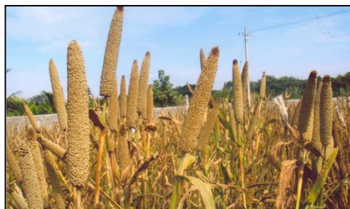
चित्र 07: फसल का सामान्य दृश्य Figure 07: General view of the crop