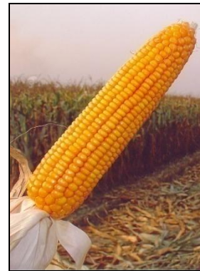
चित्र 02ख: भुट्टे का सामान्य दृश्य Figure 02b: General view of the cob